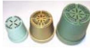
鉢 底 部