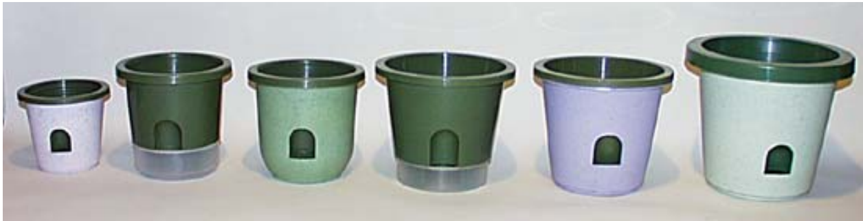
V - 4外容器