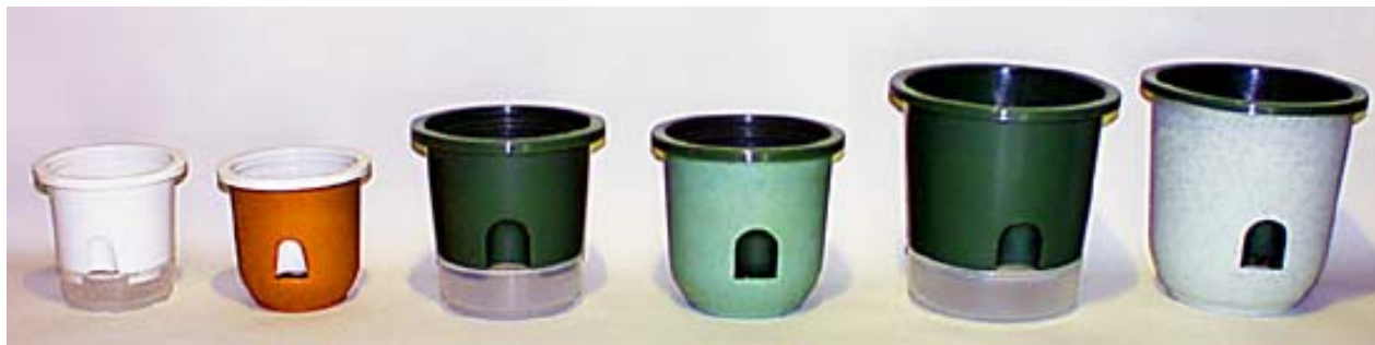
4 B P L皿