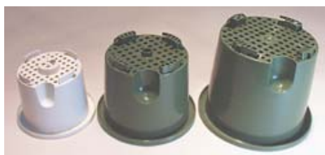
4 B P Lポット